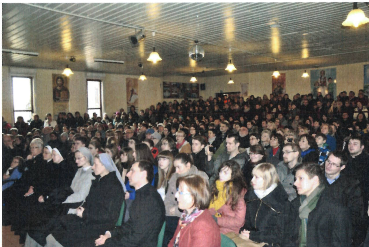
Dal 19 al 22 maggio 2014 Perugia intitolazione strada “via Beata Chiara Luce Badano” e testimonianza nel teatro cittadino.